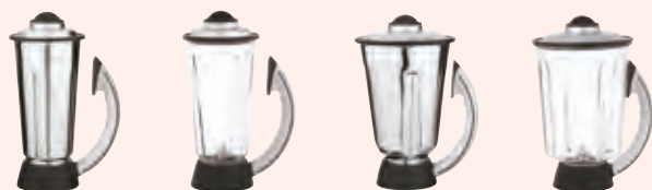
2 I 2 P 4 I 4 P