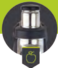
Einfüllschacht ø 79 mm