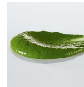
5 x pacossierte® Textur