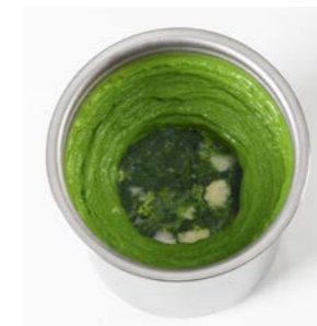
5 x pacossiert®