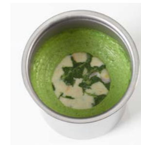
1 x pacossiert®